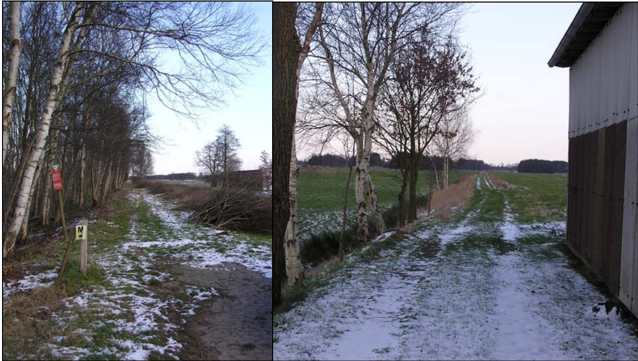
c vorhandene Fuss-/Feldwege im Bereich Isenseer Moor, Ausbau als Wander-/Fahrradwanderwege geplant

Im Zuge der weiteren Tour wurde der „Kajendeich“ (8), ein historischer Fussweg parallel zur Landstraße, der in nordwestlicher Richtung verläuft und an die „Siethwende“ anschließt, besichtigt. Es war einhellige Meinung der AK-Teilnehmer, diesen „in die Jahre gekommenen“ historischen Fussweg nach den heutigen Erfordernissen für Fuss- und Radwanderwege wieder instandzusetzen und einer breiteren Nutzung zuzuführen.