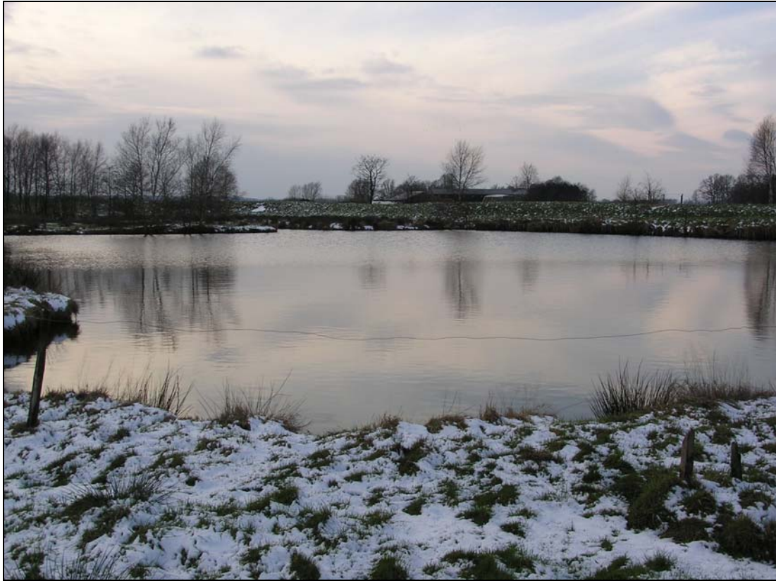
f Brack, Stillgewässer (verpachtet) an der Siethwende