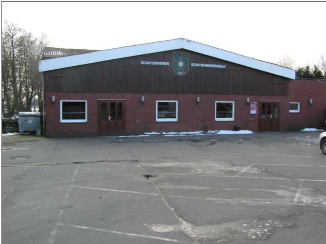
b Clubhaus des Isenseer Schützenvereins, Blick nach Südwesten

Von den Teilnehmern der Ortsbegehung wurde im weiteren Tourverlauf die fehlende Nahversorgung im Ortsteil Isensee angemerkt. Der ehemalige an der Landstraße gelegene Edeka-Markt H. Mayer (4) wird heute von einem Schiffsausrüster als Büro genutzt, einen Ersatz gibt es bisher nicht.