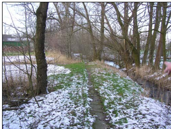
d historischer Fussweg „Kajendeich, Blick nach Nordwesten

Im Zuge der weiteren Tour wurde der „Kajendeich“ (8), ein historischer Fussweg parallel zur Landstraße, der in nordwestlicher Richtung verläuft und an die „Siethwende“ anschließt, besichtigt. Es war einhellige Meinung der AK-Teilnehmer, diesen „in die Jahre gekommenen“ historischen Fussweg nach den heutigen Erfordernissen für Fuss- und Radwanderwege wieder instandzusetzen und einer breiteren Nutzung zuzuführen.