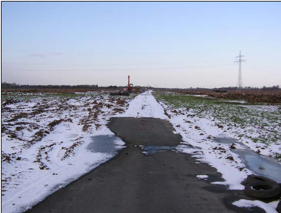
a Blick nach Nordwesten auf den zur Erschließung angelegten Weg, links das Torfabbaugebiet

Zweiter Haltepunkt (2) war der von der B 495 ca. 500 m südwestlich vor der Straße „Landwehr“ nach Nordwesten abzweigende Querweg (a), der das kürzlich eingerichtete Torfabbaugebiet im Isenseer Moor erschließt. Nach Auffassung der AK-Teilnehmer sollte dieser Weg als Fuß- und Radwanderweg ausgebaut und in nordwestlicher Richtung an das bestehende Wegenetz angebunden werden. Zur Attraktivitätssteigerung dieser zukünftigen Wanderroute soll das Areal nach erfolgtem Torfabbau renaturiert werden.