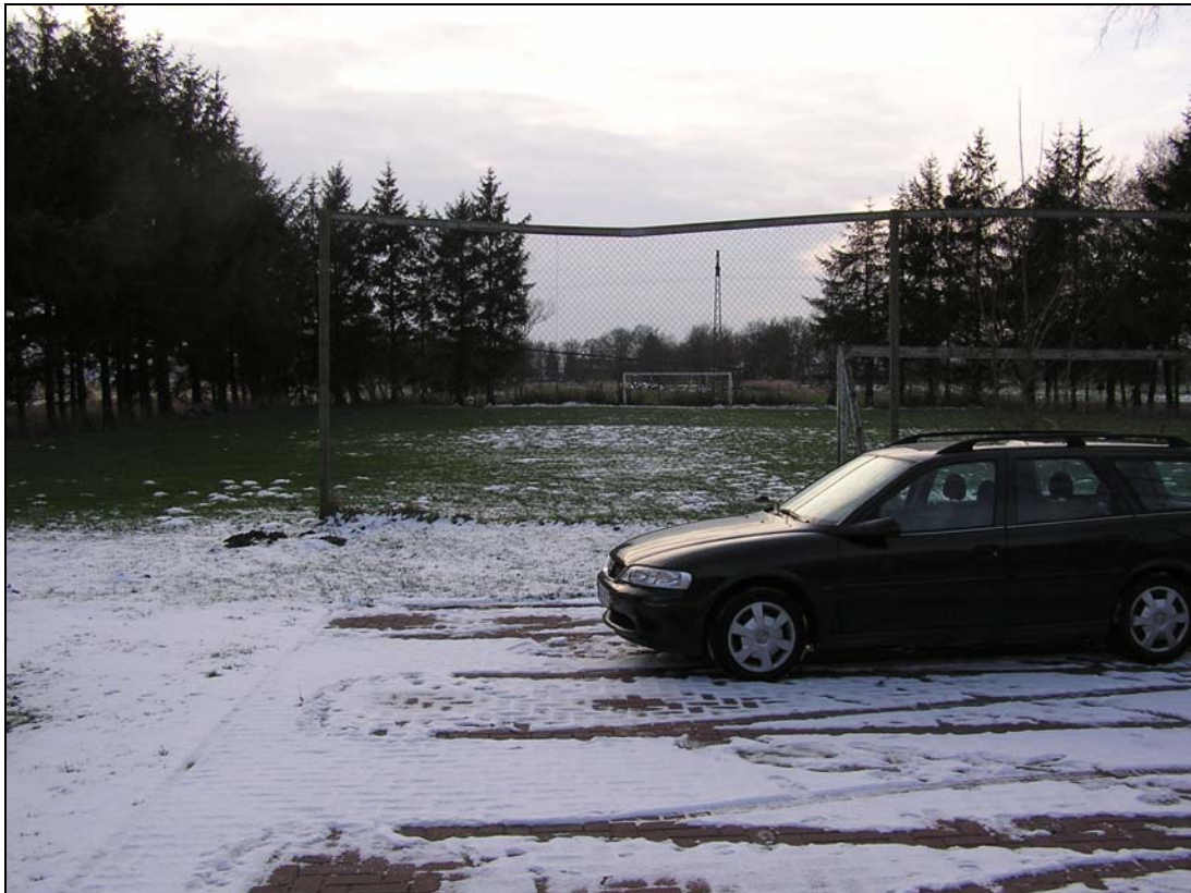
e Sportplatz in Isensee

Nach einem Abstecher zum „Brack“ (10), einem kleinen Stillgewässer (Teich) an der Siethwende, unmittelbar an der nördlichen Gemarkungsgrenze zu Oberndorf gelegen, der z.Zt. nicht vom Pächter genutzt wird und zukünftig in ein entsprechendes gesamttouristisches Wander- und Radwegekonzept eingebunden werden sollte, führte der Rundweg über die am westlichen Ende der Siethwende gelegene Gaststätte „Henning“ (11) in Niederstrich, für die eine Nachfolgeregelung noch aussteht, über die Straße „Niederstricher / Achthöfener Deich“ am Hotelrestaurant „Seefahrer“ (12) vorbei zur Tankstelle an der Kreuzung der L 113 mit der B 495 (Kranenweide). Vom ehemaligen, neben der Tankstelle (13) liegenden und inzwischen stark herunter gekommenen Gasthaus „Brüggmann“, für den aus Teilnehmersicht dringend eine Lösung mit einer zukunftsorientierten Nutzung zu finden ist, führte der Weg über die B 495 zurück zum Ortskern.